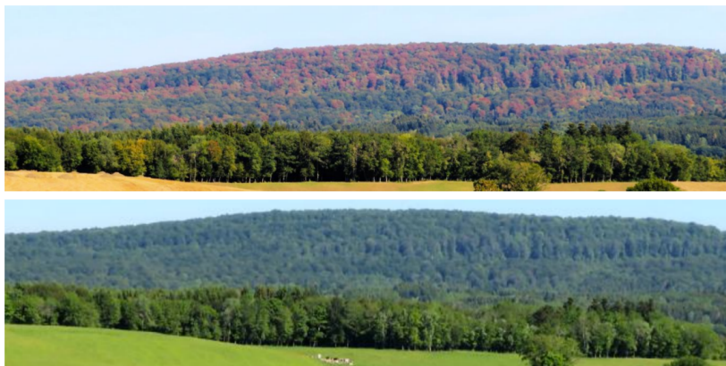
Figure 2. Massif de hêtre présentant un rougissement foliaire marqué consécutif au stress hydrique (29 juillet 2018) et la même zone le 2 juin 2019 avec un faible déficit foliaire (Naisey-les-Granges (25) M. Mirabel, DSF).

L'année 2018 a été marquée par un stress climatique très important de juin à octobre. Ce stress a entraîné un dépérissement brutal des hêtres dont les houppiers sont devenus rouges.